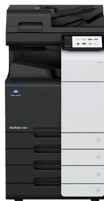
bizhub i-Serie C360i