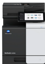
bizhub i-Serie C4050i

Wenn Ihr Unternehmen wächst, wachsen wir mit Ihnen. Wir verbinden Menschen und Orte nahtlos, um eine neue Dimension des Dokumenten-Workflows und Sicherheitsmanagements zu schaffen.