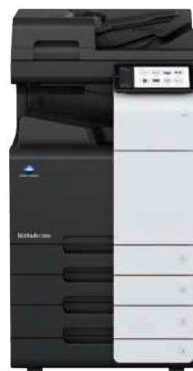
bizhub i-Serie C360i